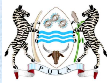
REPUBLIC OF BOTSWANA